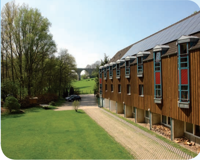
Rolleferberg liegt malerisch im Grünen

BIO ist IN, aber für die kirchliche Jugendarbeit nichts Neues. Seit Jahrzehnten beschäftigen wir uns mit den Fragen von Nachhaltigkeit und internationaler Gerechtigkeit. Dass jedoch nicht nur Einzelne, sondern auch öffentliche oder kirchliche Einrichtungen und Organisationen Verantwortung für ihre Betriebsweise und ihr Konsumverhalten übernehmen, halten wir für unverzichtbar.